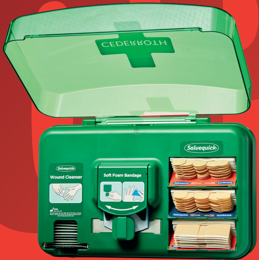
Pflasterspender Art. D383.006