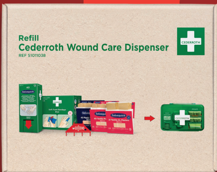
Nachfüllset Art. D383.007