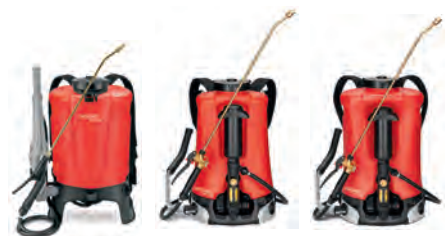
Rückensprühgeräte RPD 15, Flox 10, Iris 15