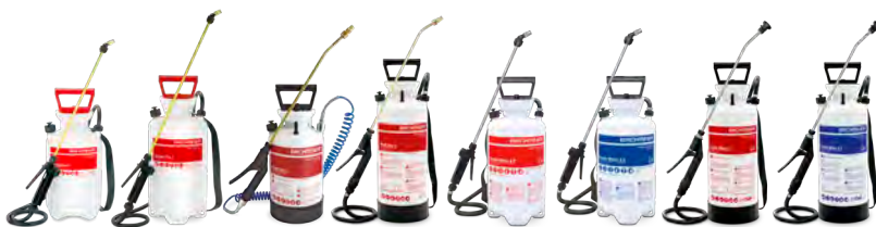
Druckspeichersprühgeräte Garden Star 3 / 5, Profi Star 3 / 5, Rondo-Matic 5 P / 5 E, Clean-Matic 5 P / 5 E