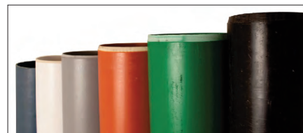
Schneidet alle Abwasserrohre